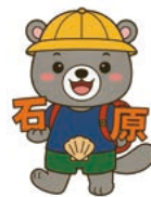
石原小 マスコットキャラクター いしわらっこ

(〒 360-0816 埼玉県熊谷市石原3-1-1) 児童数 : 671 名 学級数 : 29 TEL 048-521-0019 FAX 048-520-2875 https://kumagaya-ishiwara-e.ed.jp/