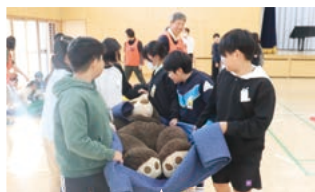
毛布で要救助者の人形を運ぶ

防災の学習として、「小学生として何ができるか」を考え、実践しています。災害が起きたときに必要な備えや助け合いについて学ぶとともに、支援物資を運ぶボランティアになったつもりで、限られた道具で避難所へ物資を運ぶ活動を行います。話し合いを重ねながら、協力することの大切さを実感しています。また、毛布で要救助者の人形を運ぶ体験、ペットボトルランタンや10円お守りの作成、ハザードマップを使った避難行動の確認、毛布での担架づくりなどの体験を通して、小学生でもいざという時に自分で考え、行動できる力を身に付けています。