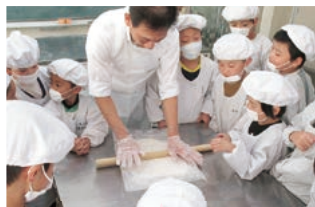
熊谷うどん作り体験

「熊谷の伝統文化を受け継ごう」をテーマに、地域に伝わる食や行事について学びます。100年フードに認定されている熊谷の五家宝づくり体験や熊谷産小麦を使ったうどんづくりを通して、昔から受け継がれてきた食文化の魅力を再発見します。また、熊谷うちわ祭のお雛子体験(表紙)では、熊谷市民のひとりとして、祭りへの思いや伝統を大切に受け継いでいこうという気持ちを高めています。