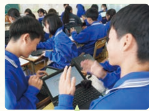
教え合い学習で考え方を説明

生徒が受け身になる授業にならないよう、教師の説明を最小限にし、生徒が考える時間を増やす授業を心掛けています。すぐに問題の解法を示さず、「なぜそう考えたか」「他の考え方はないか」と問いかけたり、教え合い学習を積極的に取り入れたりしています。特に計算問題が多い授業では、理解度が高い生徒がミニティーチャーとなり、周囲の生徒に教える活動を多く取り入れています。それぞれの生徒の理解が深まるとともに、伝え合い・学び合う活動を通して、その後の学習意欲を高められる集団づくりを行っています。