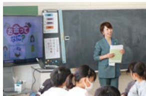
難しいことばも丁寧に説明

また、2時間目には、支払い方法の種類や売買契約の仕組みなど、3時間目は、「ニーズ(必要なもの)とウォンツ(欲しいもの)」を意識した買い物や買う場所・支払う方法などを学びました。