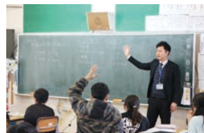
子どもたちの活発なやりとり

児童たちは、「ものを選び方、買い方を考えよう」というテーマで、「物の選び方と買い方」「参考になるマーク」「選び方、買い方のたくさんの選択肢」を勉強しました。タブレットを使って自分が欲しいものや誰かにあげたいものを検索し、価格の比較や買う場所などを調べてグループ内で共有したり、全体で共有したりして様々な選び方や買い方があることを実感していました。最後には、「買い物マスター5か条」を作成して、賢い消費者になる意識を高めました。