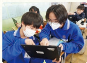
ICTを活用し、意見交換

思考の「見える化」を目的に、ミライシードのオクリンクプラスを活用した授業実践を行っています。オクリンクプラスは、生徒が自分の考えをカードにまとめ、教師やクラス全体と共有できる学習支援ツールです。立体図形の分類分けを行う授業では、カードに円柱や角錐、球などを提示し、同じ種類だと思うものを自分で動かし、自分のカードを作成します。カードを提出させると、「底面の形が同じ」「丸まった面がある」など、基準の異なる分類が画面上に並びます。カードをもとに意見を比較・整理することで、新たな視点に気づきます。教師は見守り、必要に応じて問いかけることで、主体的に考える環境を支えています。