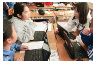
食品ロスについて話し合う

国や地域によって食料の量の差が大きいことに驚きました。食べ物を捨てている日本や先進国はフードロスを止めないといいないです。