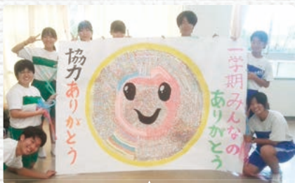
生徒会主体「目指せ6万!ありがとうプロジェクト」※ を見える化