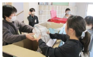
服の回収プロジェクト

SDGsの概要やリサイクルの意義、回収した服の活用法などの学びは、子どもたちが、自分たちにもできる社会貢献があることに気づききっかけとなっています。子どもたちがポスターやチラシを作成し、家庭や地域で着なくなった子供服の回収を呼びかけたことで、たくさんの服を集めることができました。難民キャンプの子どもたちに服を届ける活動は、人の役に立つ喜びを感じる取組となっています。また、本取組はUNHCR(国連難民高等弁務官事務所)から感謝状をいただきました。