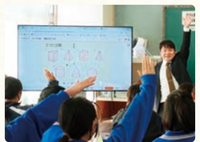
生徒が作成したカードを用いた授業