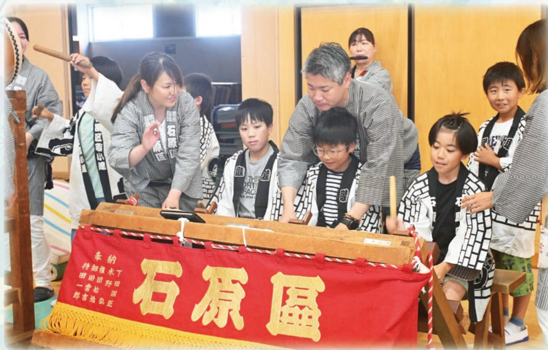
「熊谷うちわ祭 お碁子体験」 熊谷市立石原小学校 (本文 p.5)