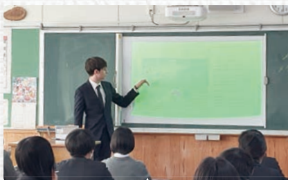
イタリア人留学生による自国の文化・生活習慣などの説明の様子