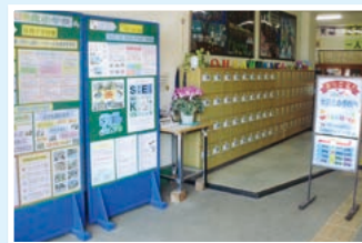
職員玄関(含学校紹介)

新栄中・大沢北小ロゴの立体作品、研究発表紀要&資料バッグ、参観者配付水、職員用Tシャツ