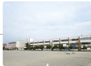
校庭から見た校舎の風景

明治6年に設立され、154年目を迎える歴史と伝統ある本校では、不易と流行を見据え、子どもたちにとってどのような力が必要かを見通し、地域とともに子どもたち育む教育活動を進めてきました。本校では、校訓である「強く 正しく 睦ましく」の精神を中核に、子どもたちが多様な環境を柔軟に受け入れ、自分らしく生き抜いていく「生きる力」を学校教育目標に掲げ、知・徳・体のバランスのよい確かな学力の育成はもとより、持続可能な社会の担い手として、自分の力で考え、判断し、行動する「未来を拓く力」を育成すべく、様々な教育活動を進めています。