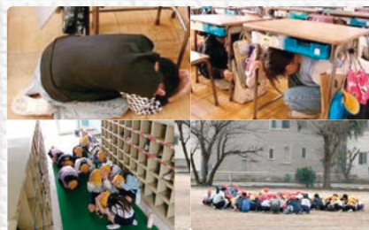
上段: 身を守る姿勢の基本 下段: 休み時間の予告なし避難訓練