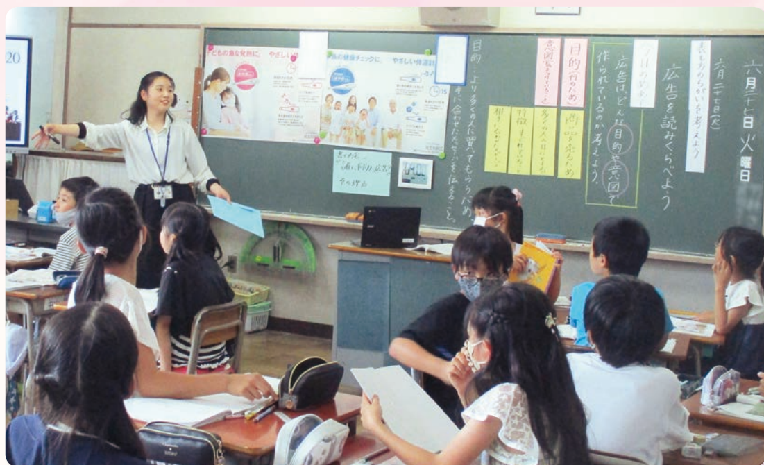
「共に学び 共に成長する 児童と先生(4年生・国語の授業)」

今年度も、様々な教育課題の改善に向けた教職員の日々の実践に「関心」を持って寄り添い、子どもたちの笑顔から「感動」をいただき、会員の皆様から託された思いへの「感謝」を忘れずに、「最終受益者は子どもたち」の理念の実現と教職員の「たすけあいの輪」を広げてまいります。皆様も当支部の会員となってこの理念の実現を一緒に追求していきませんか。