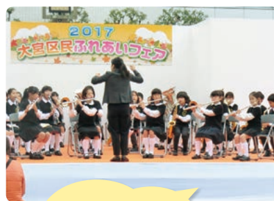
区民祭りの「ふれあいフェア」にて

子どもたちの居場所づくりとして、20 年ほど前から地域の有志によって実施されている歴史のある活動です。本年度は、さいたま市のモデル校として、今まで以上に充実した内容へと変化を遂げています。火曜日は様々な体験を、水曜日は英語活動を、土曜日は学生ボランティアも加わり、学習や科学実験など多彩な活動を進めています。