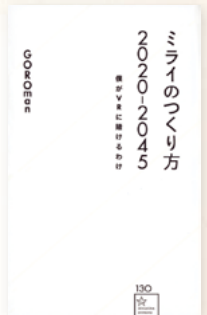
GOROman 著 星海社新書 960円(税込1,036円)

視覚以外の感覚とVRが連携する研究も進んでいるとの記事もネット上にあり、本書の中にはVR(仮想現実)は、現実的もしくは非現実的な空間を作り出し、遊びの空間や学習はもとより、医療にも役立つ技術としてこれから大きく発展する期待がある反面、使い方を間違えてはいけないものであることも書かれていました。皆さんは、どうとらえるでしょう?