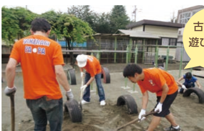
古タイヤを利用した遊び場「タイヤランド」の補修

本校のおやじの会「桜木パパの会」はたいへん頼りになる存在です。運動会では、全児童分のテントをアツという間に組み立てます。校庭の遊具の補修やお祭りでのイベントはお手の物。卒業証書授与式の朝には、卒業生一人ひとりの記念撮影まで行います。親の愛を背中ですす、とてもカッコいいお父さんたちです。そして、わが子が卒業しても OB として活動される方もたくさんいます。