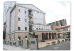
正門から校舎を臨む

平成 30 年度～平成 32 年度 さいたま市 ICT 教育等研究指定校 平成 30 年度チャレンジスクールモデル校