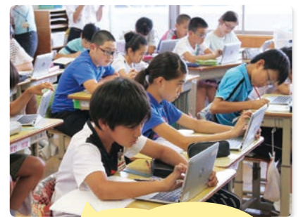
個別にタブレット端末を使用して学ぶ児童

本校では、今年度から学校課題研究のテーマを「主体的・対話的で深い学びを目指した授業改善～アクティブラーニングの視点からの効果的な ICT の活用～」とし、授業実践を中心に研修を進めています。「主体的・対話的で深い学び」を実現するために、タブレット端末をどのように活用していったらよいか日々頭を悩ませているところです。研究は始まったばかりで、試行錯誤の毎日ですが、タブレット端末に示された資料を挟んで夢中になって話し合う子どもたちの姿があらこちらで見られたり、子どもたちがタブレット端末を校長室に持ち込み、動画を撮りながらのインタビューをしたりと、子どもたちの学ぶ姿が変わりつつあることに大きな期待を感じています。