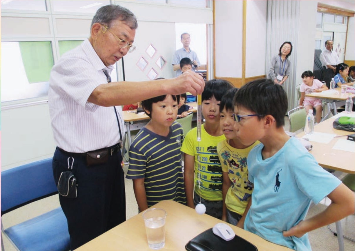
「チャレンジスクールの『面白サイエンス』で地域の方々から浮沈子の原理を学ぶ子どもたち」さいたま市立桜木小学校 (本文 3 ページ)