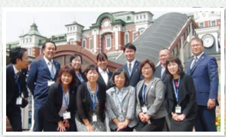
美しい深谷駅をバックに笑顔を見せる所長とLC

こんにちは、深谷営業所です。当営業所がある深谷市は、明治の実業家「渋沢栄一翁」の生誕地としても知られ、現在では、ゆるキャラの「ふっかちゃん」や「深谷ねぎ」でも全国的に有名です。担当地域は、深谷市、本庄市、寄居町、美里町、神川町、上里町で、県内営業所の中でも広範囲にわたり、フレッシュな入社1年目から27年目の大ベテランまで、LC11名で担当しております。