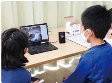
長野の高齢者施設との zoom (5年生)

しかし、負の側面だけではありません。臨時休業中に行ったオンライン学習では、教員が力を合わせ、350本を超える動画作成・配信を行い、教員のICTスキルが格段に向上。コロナ感染に配慮するが上に、zoom、meetなど遠隔会議システムも使いこなせる教員に成長しました。企業や施設などの専門家に遠隔で授業に参加していただき、児童と直接対話する機会をつくることはとても有効であると考えています。昨年度は、zoomの活用により、長野県の高齢者施設、アップサイクル協会、ヘンケル