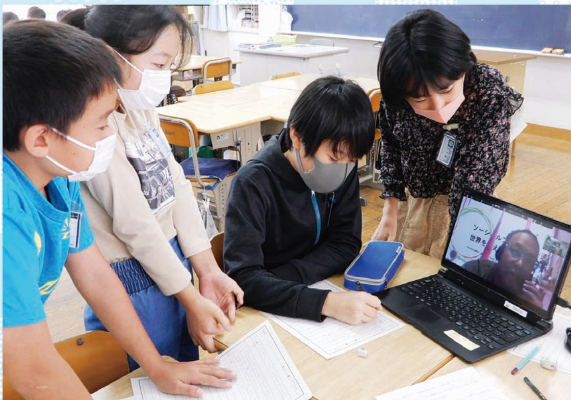
「アップサイクルの専門家との ZOOM 会議 (6年生)」(本文 3 ページ)