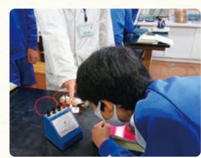
目盛りの読み取りを個別に支援している様子(前任校での実施)

指導計画を見直すなかで、単元の実施時期を近隣中学校と計画的にずらしながら、備品を借用した。特に効果的であったのが「電流とそのはたらき」の単元における電流計、電圧計、電源装置の借用である。実験班に1つ程度の備品等を1人1セット確保することができた。観察、実験等を苦手に感じる生徒も具体的に操作する必要性に迫られることで活動が促された。ただし、町内全校での計画的な実施が困難であった点、個別化することで観察や実験の技能についての支援が必要な場面が多くなった。そのため、活動中に思考を深めさせる支援の時間的な確保や効果的な方法に課題を感じた。