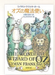
ライマン・フランク・ホーム 作 河野 万里子 作 にしざかひろみ 絵 新潮文庫 539円(税込)

ジェンダーの視点を意識するようになって、本の読み方も変化しています。この物語で、きこり・かかし・ライオンが、望みのために自ら冒険に出て戦い、成功を勝ち取るのに対し、女の子であるドロシーは、巻き込まれた形で冒険に出て、成長や報酬もなく元の生活に戻ります。このように古典的な物語では、女の子は主体性や成功を期待されてもいないことに気づかされるのです。皆さんも、一度感動した物語を読み直して、その中の性別役割について考えてみませんか。その見方は、もしかしたら目の前の子どもたちとつながるのかもしれない。