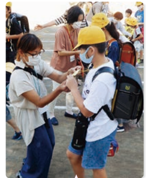
地域の方の協力を いただいた 朝の健康チェック

6年生の修学旅行については、2度時期を変更し計画しましたが、緊急事態宣言延長により、実施ができませんでした。卒業式も分散で実施し、密をつくらないようにしました。