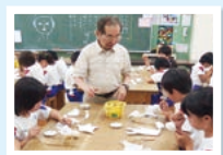
かみしも人形づくり

このように、花と人形の町である鴻巣の歴史文化を通じて、地域の皆さんとのコミュニケーションを大切にしている素敵な鴻巣南小学校の先生方に、これからもお役に立てるよう、精一杯努めさせていただきます。