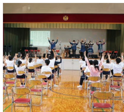
(コーラスに合わせて手話で表現)

当支部にとっても約一年ぶりとなるコーラスをコラボしての公演は、マスク越しでしたが、子どもたちの笑顔をたくさん感じることができ心に染み渡り、とても新鮮でした。