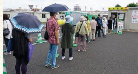
さいたま市集団接種の予習

当支部が主催した「教育懇談会」(7月21日開催)で、小学校・中学校・高等学校・特別支援学校の校長先生たちもコロナ禍の学校運営に苦心されていたお話をたくさん伺いました。例えば「コロナ禍で2年目を迎えるが、学校をまわし、教育活動をまわし、コロナ対応している今年のほうがはるかに負荷がかかる」などと言われていました。子どもも、教職員も、保護者も、みんなに負荷がかかっている今、学校は無理をせずにゆっくりと学びを進めていってほしいと願っています。