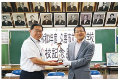
(「優勝カップ」を贈呈)

久喜市立江面小学校は、令和3年4月1日に江面第一小学校と江面第二小学校が統合し、2校の歴史と伝統を受け継ぎ、新たに江面小学校として、開校しました。