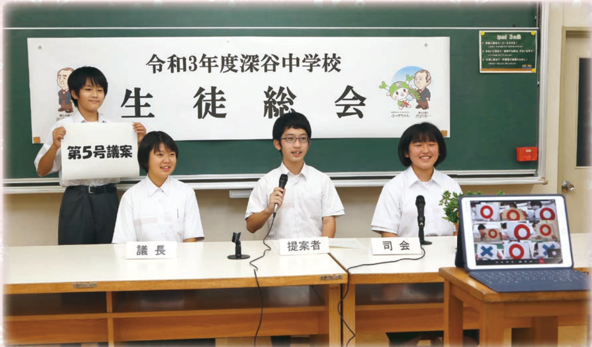
(教育研究助成金「学び合い・高め合い支援事業」を活かした教育活動・「オンラインで採決する生徒総会」 深谷市立深谷中学校)