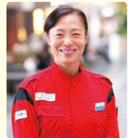
制服でご講演いただいた 新津春子様