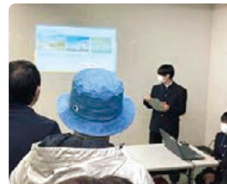
おがわ学フォーラムでは、生徒たちが地域の皆さんに探究の成果を発表しました。また、地域の皆さんにおがわ学の学びを体験していただきました。

もう一つの魅力は、学びを通じて地域創生に貢献するという視点です。地域住民の方々にとっても関心の高い地域に関する学びを、学校が有する教育資源を活用して提供する仕組み（「大人のおがわ学」）も整い始めています。