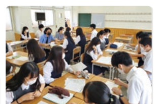
グループごとに、自分の考えを報告し、探究内容を更に深めます。