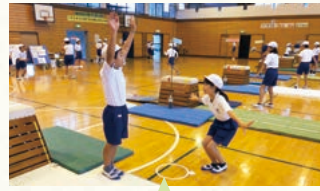
技の精度について意見交換をする場面

「発問」の一例 T 「膝伸台上前転を行うときに、勢いが足りないという意見があったけど、どうすればいいかな。」 C 「しっかり、両足で踏み切ります。踏切に勢いがついて、腰が高く上がります。」 T 「いいね。今日は両足で踏み切り腰が上がる、膝伸台上前転をやる。」