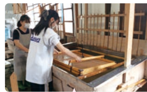
ユネスコの世界文化遺産に登録された細川紙をはじめ、和紙づくりが盛んな小川町ならではの和紙漉き体験ができます。

小川町には、美しい里山や清流などの豊かな自然、長い歴史と伝統に育まれた文化、細川紙と小川和紙など先人たちの知恵を生かした様々な産業や技術など、探究すべき教育資源が豊富にあります。「おがわ学」は、こうした地域の教育資源を活用した探究的な学びによって、生徒の未来と地域の未来を切り拓く学びです。