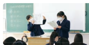
様々な資料やデータを分析し、どうしたらその課題を解決できるのか、自分の考えを提案します。3年生は、探究した成果を発表して、みんなで意見を交換し、自分たちの考えをブラッシュアップします。

「おがわ学」に関わる小・中学校及び本校の教員を対象としたアンケート結果でも、「おがわ学を通じて、児童生徒の『学び』や『成長』を感じられることができましたか。」という問いに対しては、実に 97.4%の教員が肯定的に回答しています。