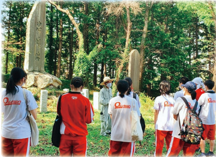
(「令和」という元号の出典である『万葉集』ゆかりの仙覚律師を訪ねます。埼玉県立小川高等学校 本文P.3)