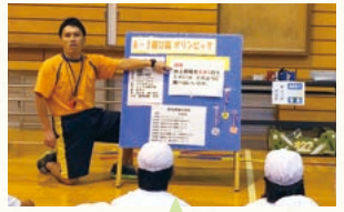
児童に「問い」を与える発問場面