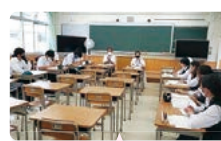
小川町役場の職員の方々を囲んで、小川町の課題について学ぶための打ち合わせの様子です。

「おがわ学」には、この意見のように、現状に対する建設的な改善、よりよい学びや地方創生に向けた改善の視点があります。今後も、「おがわ学」を通じて成長する生徒たちの笑顔を信じ、「おがわ学」に関わる皆様の力で「おがわ学」を推進したいと思います。