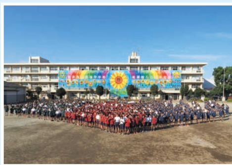
創立50周年を記念して創ったジャイアントアート

今回ご紹介させていただく学校は、令和2年に創立50周年を迎えた所沢市立向陽中学校です。「陽に向かう」という名前の由来通り、先生も生徒の皆さんも