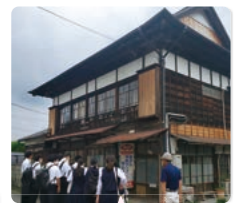
1年生は、町内の史跡をフィールドワークして学びます。