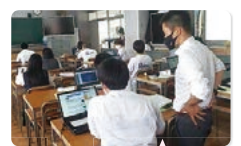
ICTを活用した教室での学びは、探究的な学びのための第一歩です。