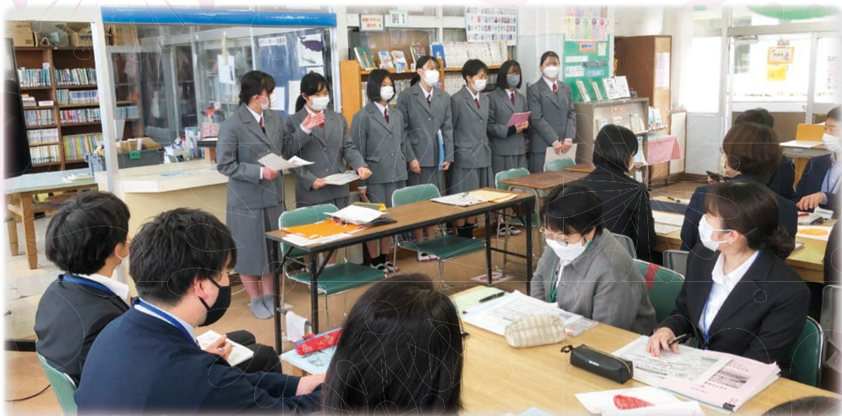
「4 月最初の職員会議で生徒会による『私たちはこう育ちたい』宣言」 所沢市立向陽中学校 (本文 p.5)