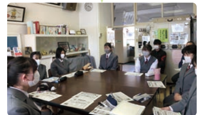
「学校教育デザイン」について校長先生と話し合う生徒会本部役員

自分たちの生活のことを自分たちの目線で話し合うことは、意見がたくさん出てきて面白かったです。人の気持ちを考えることってあまりしたことがありませんでしたが、そういうことが大事なんじゃないかと思いました。