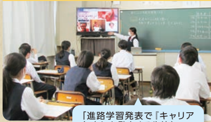
「進路学習発表で『キャリア年表』を発表する生徒」