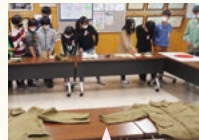
本物の戦争遺品と真剣に向き合う

郷土資料館と連携し、土器や戦争遺品等、本物に触れる機会を大切にしています。“物言わぬ本物”は、教科書以上に、多くのことを子どもたちに伝えてくれます。また、地域の方に進んでゲストティーチャーをお願いしています。地域のために実際に工夫や努力をしている方の姿は、地域への誇りや愛情につながります。本物(者)とつながる体験は、子どもたちにとってかけがえのない学びだと考えています。