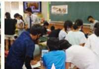
問いの解決に向けて友達と進んで対話する

児童の感想 本物の戦争中のものを見て、戦争が“本当にあった出来事なんだ”という実感がわきました。戦争のおそろしさや平和の大切さを、私たちが伝えていかなければいけないと強く思いました。