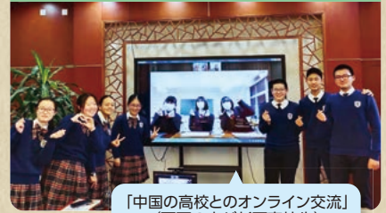
「中国の高校とのオンライン交流」(画面の中が杉戸高校生)