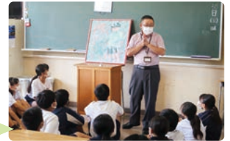
対話型朝鑑賞の様子

こうして大人の方とテーマに沿って話すことは初めてでしたが、とても新鮮でした。思っていることを口にしてみるとなんだかすっきりしました。