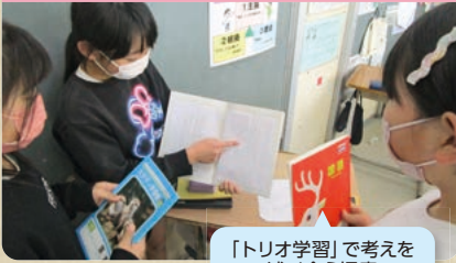
「トリオ学習」で考えを述べ合う児童