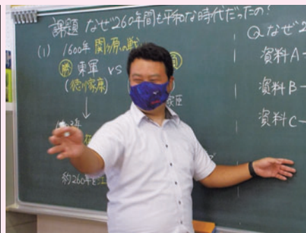
生徒とのやりとりを大切に授業を通して生徒の発想力や考える力を育てる若手教員