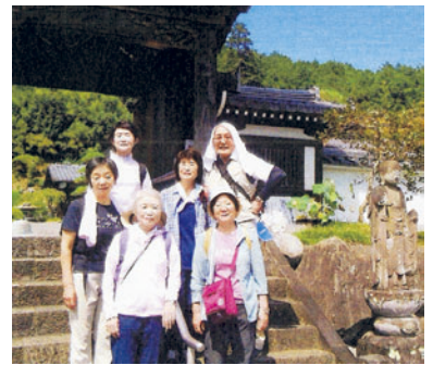
日高市・高麗神社にて(令和元年9月)

コロナ禍で外出を控え、歩くことも減り、体調を崩した、という話を聞きます。感染防止対策をしっかりし、緑豊かな自然や歴史ある町並を歩きながら、心も体もリフレッシュしてみませんか。参加お待ちしております。