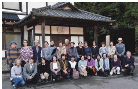
令和元年度 親睦旅行 「栃木・ましこ悠和館」にて

このような非常時に、役員の皆様には、会員との連携を献身的に進めていただいております。日々のお力添えに心から感謝しております。