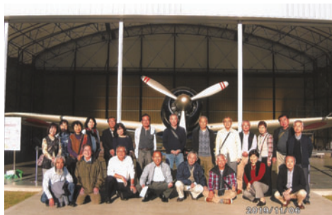
令和元年度親睦バス旅行（参加者22名） 「予科練平和記念公園」にて

会員相互の親睦や交流を目的に、11月2日(火)に今年は群馬県沼田市方面を予定しています。例年ですと30名位が参加していただき、交流親睦を深めています。今年も状況によっては中止を含め検討しています。