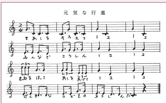
左記冊子掲載の手書きの楽譜 「元気な行進」