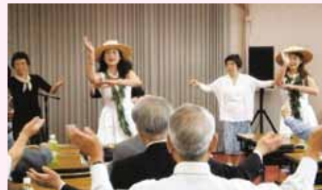
支部総会でのハワイアンライブの様子 (平成28年度 埼玉南支部)

当会及び各支部においても、会員同士の生涯福祉と親睦を図り、心温まる交流や感動との出会いの時をともに共有できますように、活動を進めるに当たっては、「Withコロナ」の視点を忘れずに、新たな活動の形態も模索しつつ、皆様方のお力を合わせて「そろりそろり」と取り組んでいく必要があると考えます。よろしくご協力をお願い申し上げます。