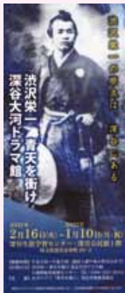
深谷大河ドラマ館 入場券

に感謝の意を込めまして、NHK大河ドラマ「青天を衝け」のロケセットが展示されていた深谷大河ドラマ館入場券を抽選により贈呈いたしました。50名様（各2枚1組）の枠に対して約3倍の方々からご応募いただきました。残念ながら贈呈が叶わなかった皆様方にはお詫び申し上げます。改めて、コロナ禍にあっ