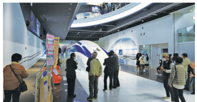
山梨県立リニアモーターカー見学センターにて

会報は、年二回発行しています。事務処理や文書作成等の担当が偏っているため、今後は、組織的に役割を分散し、充実した支部運営を進めていきたいと考えています。