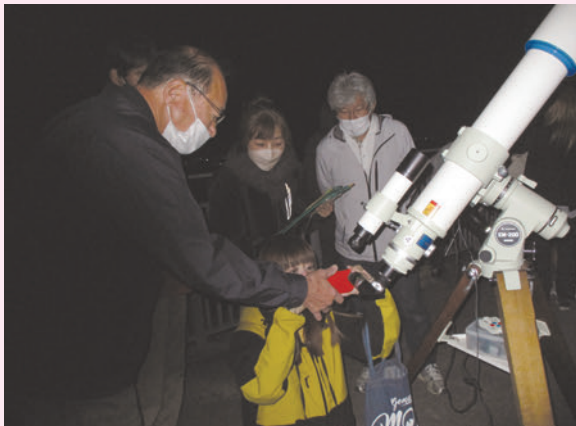
ダブル食（皆既月食と天王星食）を記念に撮るぞ

長い尾を引く池谷・関彗星 (1965f) を見てから、私は星の世界の虜となってしまいました。それから50年余り、自宅近くの天体観測所や星空キャンプに出かけては、天体写真の撮影や月・惑星の観望などをおおいに楽しんできました。浄土平や乗鞍岳で見上げる満天の星空や天の川は本当に美しいものでした。