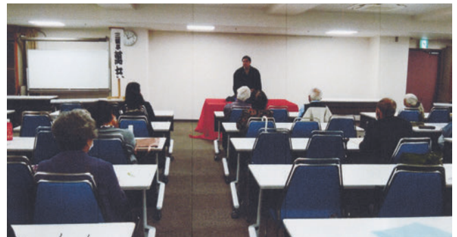
令和4年度 支部総会

長い間に正副支部長の役割分担に片寄りが生じていたが、できるだけ均衡化を図り、片寄ることのないよう見直しを図った。また、役員相互の連絡を密にし仕事の見える化を図るために、役員会を不定期に開いている。